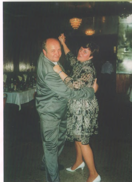
В вихре вальса

– Скажем так, базовые действия я выполнить могу. В этом плане меня восхищают внуки: уже в шесть лет они обращаются с компьютером свободно, словно «родились с ним». А вот, помню, в 89-ом году, когда я заведовал районом, пришли к нам первые компьютеры. Самые первые, я даже не знаю, как они назывались. И мне дали задание распространить их среди учителей. Так никто их не взял – были не нужны!