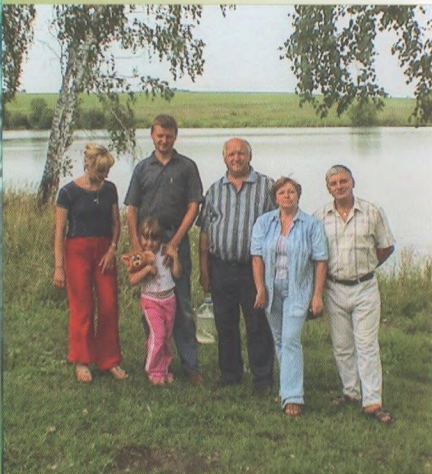
В кругу семьи