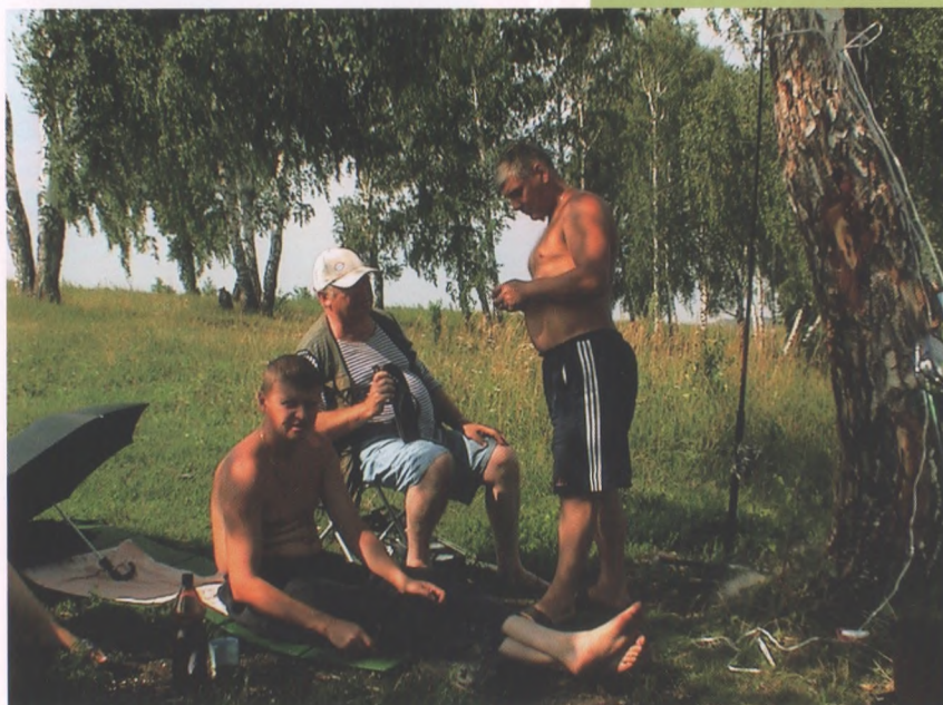
Рыбалка – мужское занятие!

– Самый лучший отдых для меня – посидеть с удочкой на берегу. И при этом не важно, какую рыбу я поймаю. Я люблю рыбалку за тишину и уединение, общение с природой. Я очень ценю такие минуты вдумчивого одиночества. А за рубежом я был всего два раза: служил в группе советских войск в Германии и один раз выехал на лечение в Карловы Вары. В общем, меня заграница не принима-