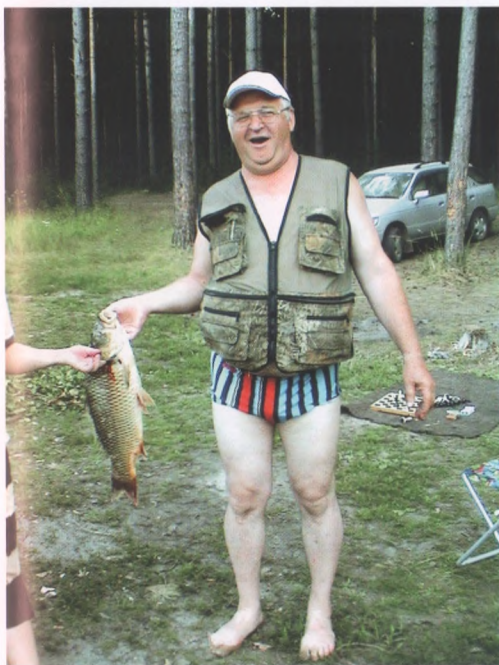
«А вам слабо?!»

он недалеко от центра города – всем будет удобно добираться до работы.